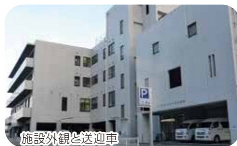
施設外観と送迎車