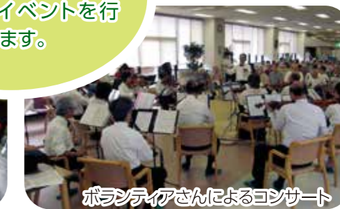
ボランティアさんによるコンサート