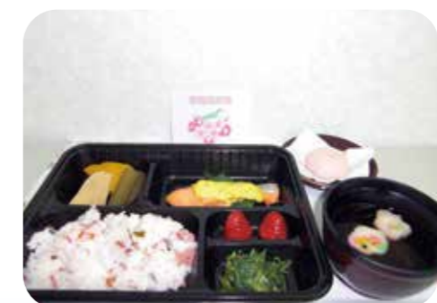
昼食のメニュー例

管理栄養士によるバランスの取れたおいしい食事を提供いたします。 おかゆ・きざみ等の調理方法や食事制限にも対応しております。