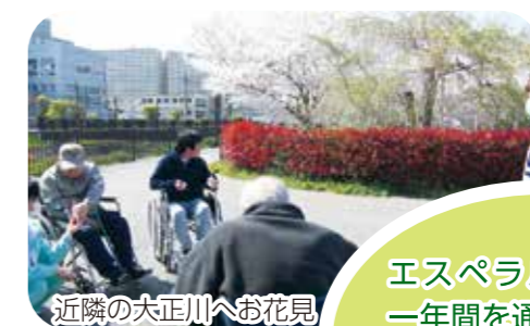
近隣の大正川へお花見

看護やリハビリ等を必要とされる要介護者が、個々の能力に応じた自立生活を営むことができるように施設サービス計画に基づいて、必要とされる医療ケアサービスと生活ケアサービスを提供します。