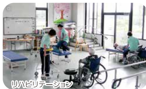
リハビリテーション

当施設に通っていただき、通所リハビリテーション計画に基づいて介護・食事・入浴・リハビリテーション・レクリエーションや口腔ケア等により自立した日常生活を送れるよう支援いたします。